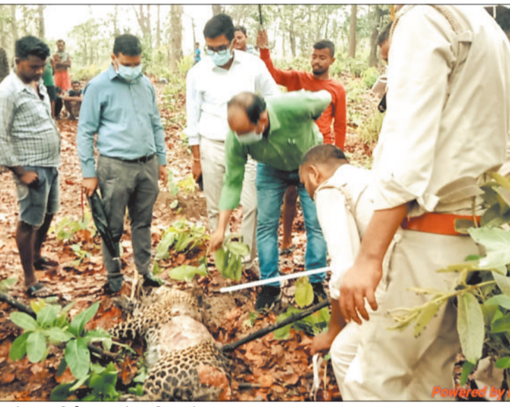
मृत तेंदुए का निरीक्षण करते वन विभाग के अफसर।

दो दिन पहले ही तेंदुए ने तीन बकरियों को अपना निशाना बनाया था जिसके बाद दूसरे दिन तेंदुए को शिकारी ने अपना शिकार