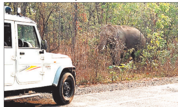
एनएच में सड़क किनारे खड़ा दंतैल हाथी।

हरिभूमि न्यूज कोरबा कटघोरा वनमंडल में हाथियों का झुंड लंबे समय से डेरा डाला हुआ है और हाथी अब हाईवे को ही अपना स्थाई ठिकाना बना चुके हैं और