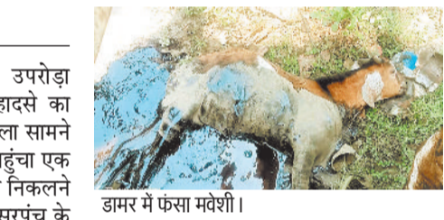
डामर में फंसा मवेशी।