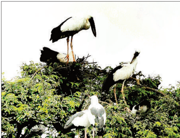
पेड़ पर डेर डाले प्रवासी पक्षी।

जिला मुख्यालय से लगभग 25 किलोमीटर दूर स्थित ग्राम कनकीधाम प्राचीन शिव मंदिर के साथ ही प्रवासी पक्षी एशियन बिल ओपन स्टॉक के लिए जाना जाता है। ये प्रवासी पक्षी हर साल विदेशों से लंबी उड़ान भरकर मई के महीने