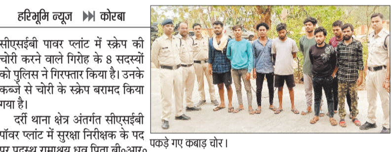
पकड़े गए कबाड़ चोर।