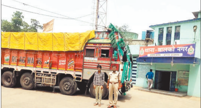
जान ट्रक व पुलिस गिरफ्त में आरोपी।

हरिभूमि न्यूज कोरबा बालको संयंत्र से दो ट्रकों में 2 करोड़ 60 लाख रुपए कीमती एल्युमिनियम की सिल्ली लोड कर गुजरात भेजा गया था लेकिन उक्त एल्युमिनियम सिल्ली गुजरात पहुंचने के बजाय दिल्ली पहुंच गई थी और उस खपाने की तैयारी थी लेकिन पुलिस की