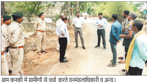
ग्राम कनकी में ग्रामीणों से चर्चा करते वनमंडलाधिकारी व अन्य।

में अपनी दस्तक देते हैं। बताया जाता है कि 100 प्रवासी पक्षियों का एक जल्था पीपल, चिरौल, इमली के पेड़ों पर पहुंच चुके हैं। धीरे धीरे कर 25 से 30 मई के बीच हजारों की संख्या में ये